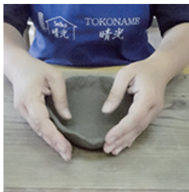
⑤好みの形にしています