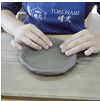
④均等に土をよせて 曲げていきます