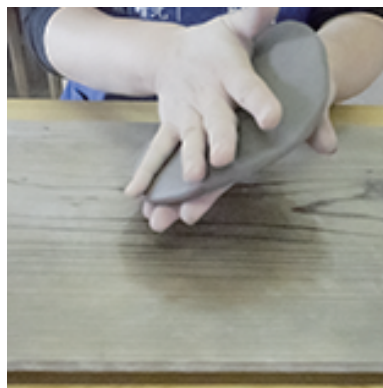
②両手で平にします (5mm程度)