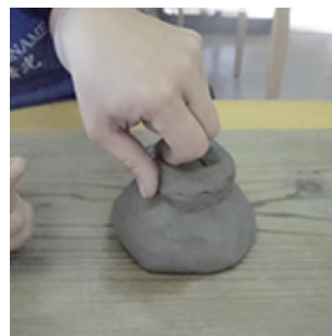
⑦つまみながら高台の 高さを調整していきます