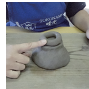
④指でなぞりくっつけていきます