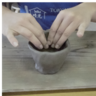
④イメージより広がった場合は、 両手でつまみながら寄せていきます