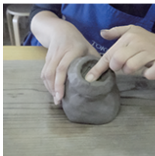
⑤内側もなぞり整えていきます