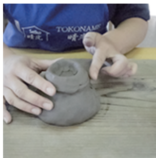
⑥ひび割れが無くなるまで なぞります