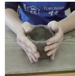
⑧軽くトントンし底を 安定させて完成です