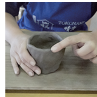
⑥ひび割れがある所を整えます