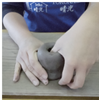
②親指で穴をあける (底の厚み1cm程度)