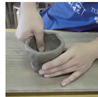
③5mm程度の厚みでつまんでいきます (※お茶碗は広げながら)