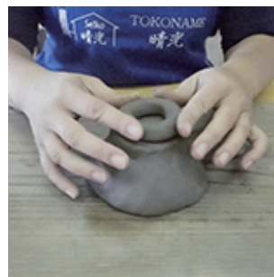
③作品を裏返して上に乗せます