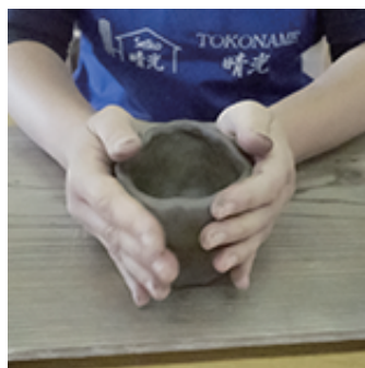
⑤軽くトントンし底を安定させます