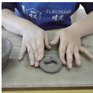
②細長くのばして円を作ります