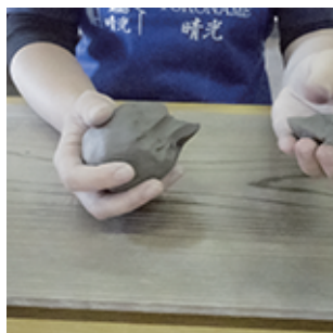
①高台用に少し土を取ります